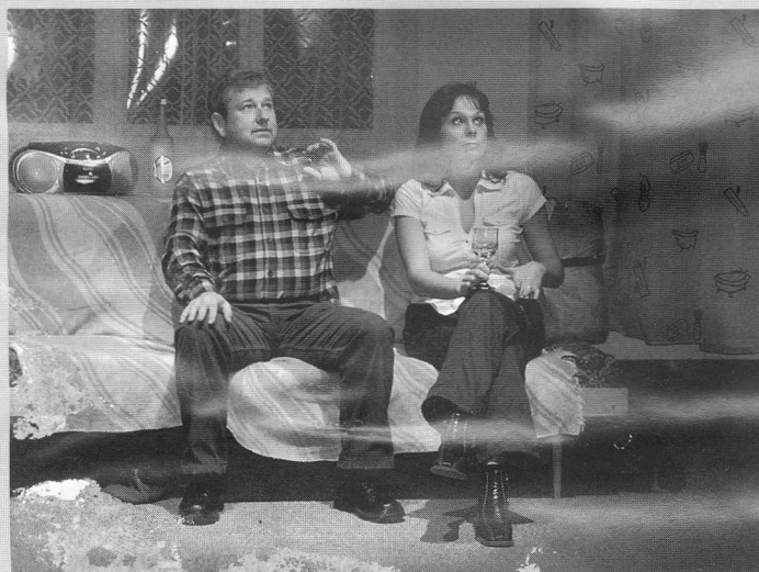
Divadlo Jaromíra Hrušky z Trhových Svin, Antonín Procházka: Celebrity , s. r. o. 17b5

"Jak to bylo s Rženkou 1000? Jevišť se baví a hledíšť též. To bývá ojedinelé. Představení je pro nás vítaným relaxem i zamyšlením nad tím, jak nakládat nekvalitní předlohou. Odpověď je jasná. Buď ji neinscenovat, anebo s ní zacházet, jak si zaslouží!"